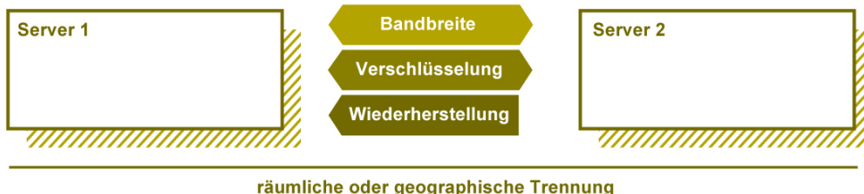
Die Paninfo Disaster-Recovery-Kompetenz

Nehmen Sie unverbindlich mit uns Kontakt auf! Unsere Spezialisten beraten Sie gerne.